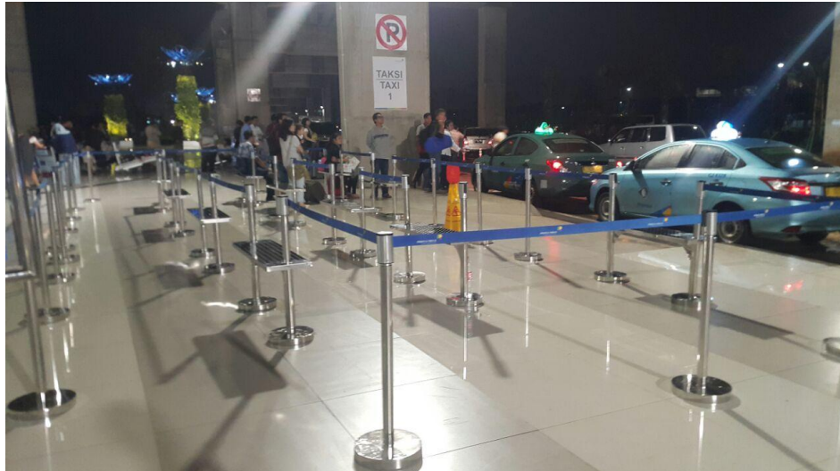
Situasi dan Kondisi Area kedatangan Terminal 3 Kembali Normal

TANGERANG - PT Angkasa Pura II (Persero) berhasil mengatasi genangan air di area kedatangan Terminal 3 Bandara Internasional Soekarno-Hatta dalam waktu 15 menit.