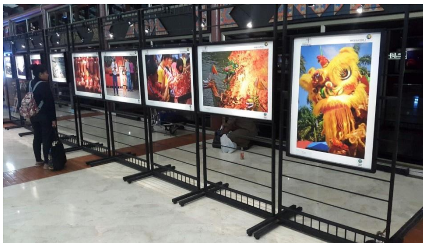
Pameran foto bertemakan Imlek di Terminal 2